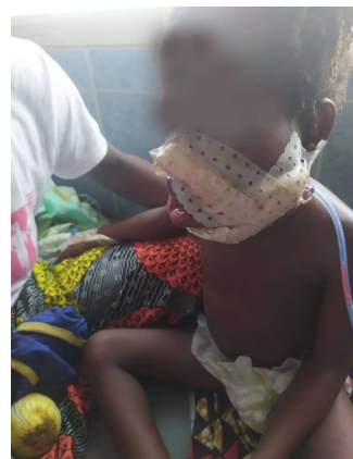
Visite à l'hôpital après l'opération chirurgicale