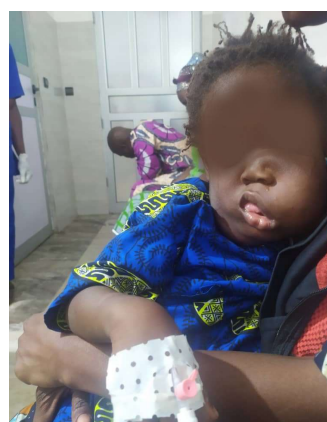
Bébé en salle d'attente du bloc opératoire de l'hôpital