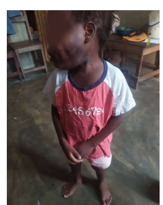
Visite à domicile après l'opération chirurgicale

Caritas reçoit des dons matériels et monétaires Mobile Money au N° +229 97 34 44 72 ou par Moov Money au N° 60 94 27 27 ou par dépôt ou virement bancaire sur le compte BOA N° 072 590 200 02 Caritas Bénin mobilisation de ressources.